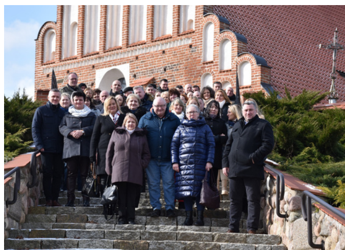
Referat Współpracy Partnerskiej i Rozwoju Kapitału Ludzkiego